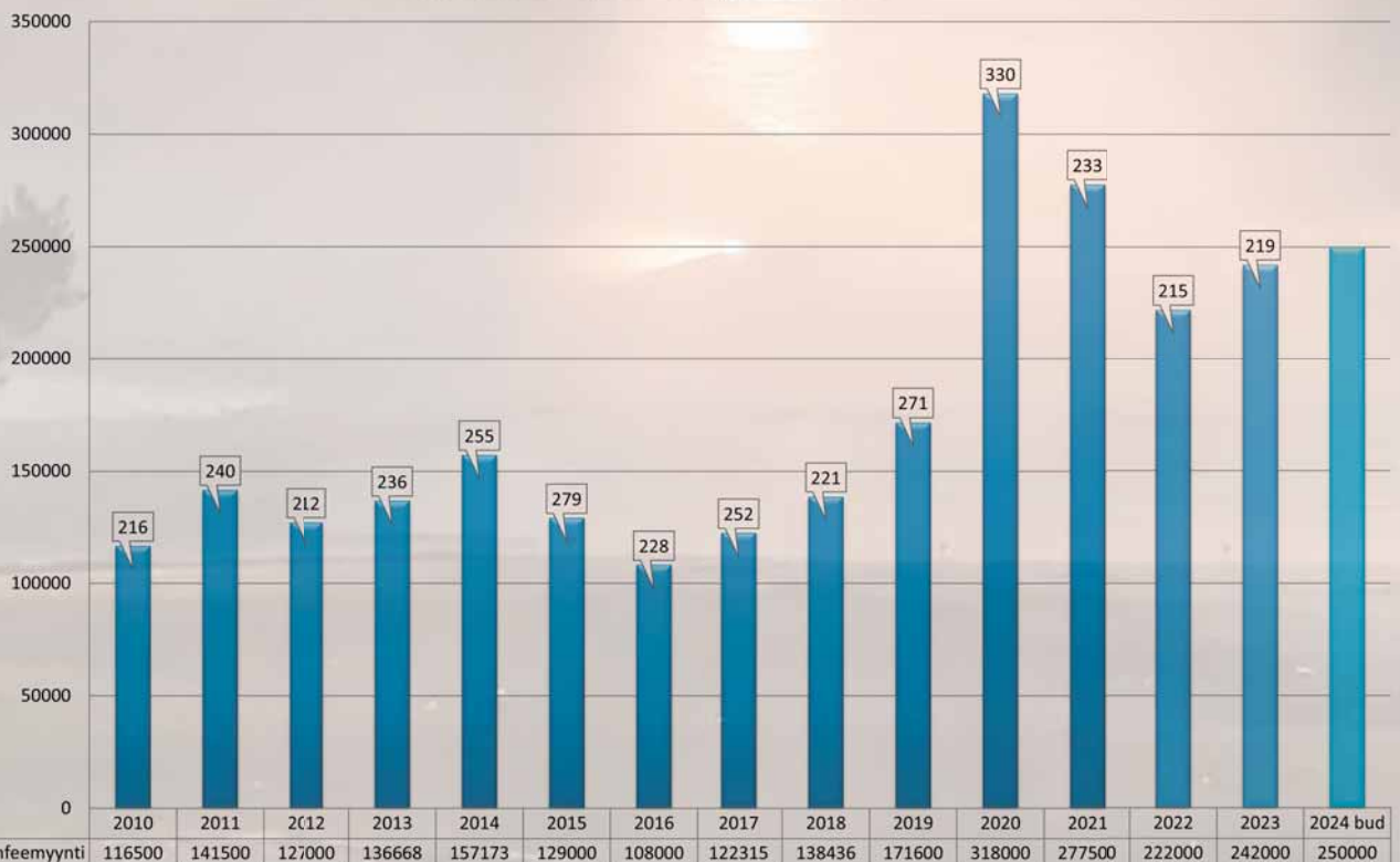
Päivämaksutulon kehitys 2010-2024

Klubitalon ja huoltohallin katoille keväällä 2023 asennetut aurinkopaneelit ovat osoittautuneet toimiviksi. Klubitalolla käytännössä kaikki paneeleilla tuotettu sähkö käytetään itse ja paneelit kattavat noin kolmanneksen kesäajan sähkönkulutuksesta. Huoltohallilla osa tuotetusta sähköstä jää yli ja se myydään verkkoyhtiölle. Takaisinmaksuaika paneeleille on nykyisellä käytöllä noin 6-7 vuotta.